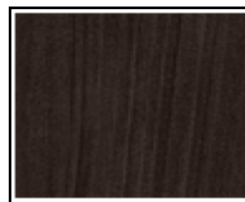
Orme Noir D'Amérique